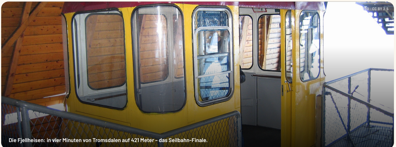
Die Fjellheisen: in vier Minuten von Tromsdalen auf 421 Meter – das Seilbahn-Finale.

Tickets am Schalter der Talstation (retour ab ~595 NOK). Bahn fährt jede volle & halbe Stunde, Bergcafé bis 23:30. Wer Beine hat: die Sherpatrappe hoch – aber kein Muss.