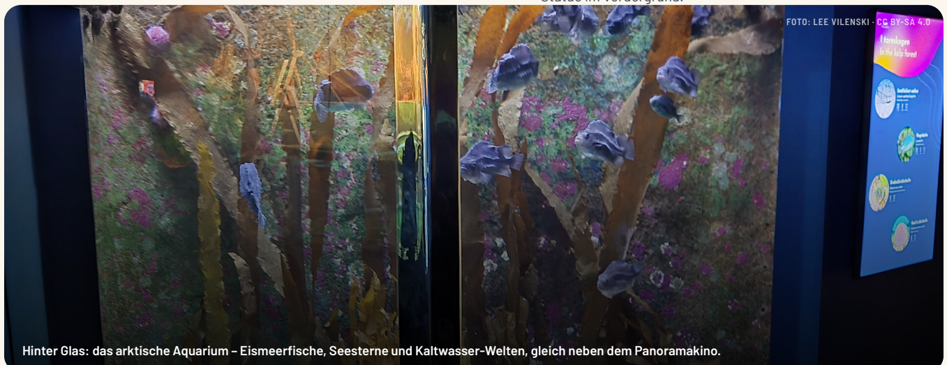
Hinter Glas: das arktische Aquarium – Eismeerfische, Seesterne und Kaltwasser-Welten, gleich neben dem Panoramakino.