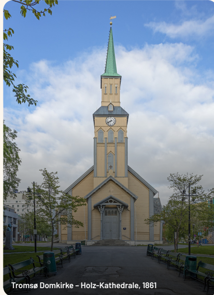
Tromsø Domkirke – Holz-Kathedrale, 1861