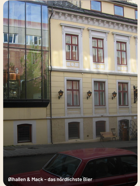
Ølhallen &amp; Mack – das nördlichste Bier