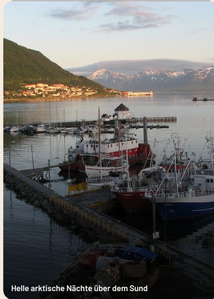
Helle arktische Nächte über dem Sund