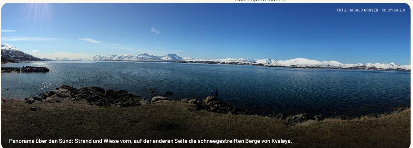
Panorama über den Sund: Strand und Wiese vorn, auf der anderen Seite die schneegestreiften Berge von Kvaløya.