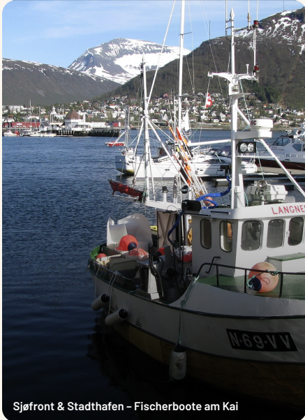
Sjøfront & Stadthafen – Fischerboote am Kai

Tromsø wirkt beim Ankommen größer, als es ist – weil es seit 200 Jahren über seine Verhältnisse lebt: Universität, Kathedralen, Festivals, das Tor zur Arktis. Die Stadt lebt nicht von einzelnen Sehenswürdigkeiten, sondern von Lage, Licht und Geschichten, die im Eismeer liegen.