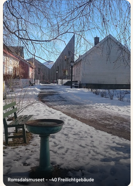
Romsdalsmuseet – ~40 Freilichtgebäude