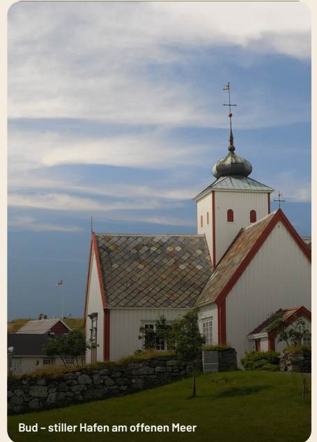
Bud – stiller Hafen am offenen Meer