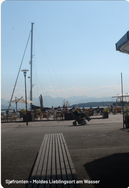
Sjøfronten – Molde's Lieblingsort am Wasser

Molde wirkt beim Ankommen modern – weil es das ist: 1940 zerstört, danach bewusst neu gebaut. Die Stadt lebt nicht von einzelnen Sehenswürdigkeiten, sondern von der Uferzone am Fjord, der Aussicht vom Varden und ein paar Geschichten, die in der See liegen.