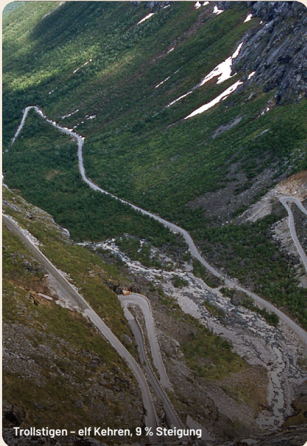
Trollstigen – elf Kehren, 9 % Steigung

Wer früh dran ist oder einen zweiten Hafentag hat, findet rund um Molde mehr als genug: stille Fischerdörfer, eine Höhle voll blauem Licht und die berühmtesten Serpentinafen des Landes.