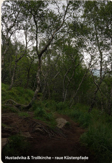
Hustadvika &amp; Trollkirche – raue Küstenpfade