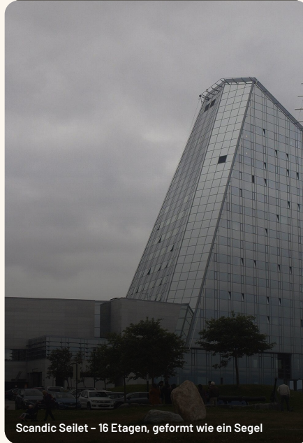
Scandic Seilet – 16 Etagen, geformt wie ein Segel