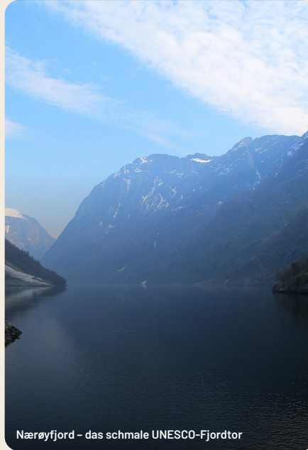
Nærøfjord – das schmale UNESCO-Fjordtor