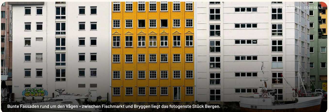
Bunte Fassaden rund um den Vågen – zwischen Fischmarkt und Bryggen liegt das fotogenste Stück Bergen.

Bergen ist seit 2015 UNESCO-Kreativstadt der Gastronomie – die einzige Norwegens. Der Markt ist ihr lautes, salziges Herz.