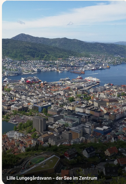
Lille Lungegårdsvann – der See im Zentrum