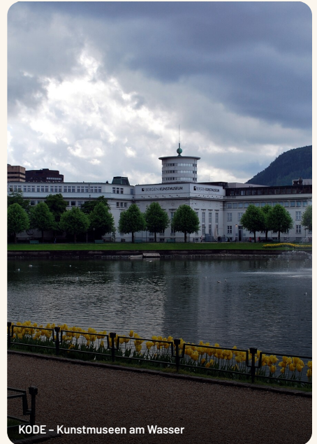
KODE – Kunstmuseen am Wasser