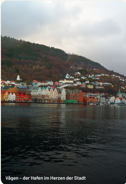
Vågen – der Hafen im Herzen der Stadt

Bergen ist Norwegens zweitgrößte Stadt – und seine nasseste. Eingerahmt von sieben Bergen, gegründet um 1070, einst Hauptstadt und Hanse-Metropole, heute das selbstbewusste Tor zu den Fjorden. Eine Stadt, die ihren Regen liebt.