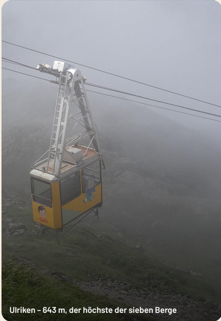
Ulriken – 643 m, der höchste der sieben Berge

Wer früh dran ist oder einen zweiten Hafentag hat, findet rund um Bergen mehr als genug: einen zweiten, höheren Berg, das Tor zu den echten Fjorden und das Zuhause eines Weltkomponisten.